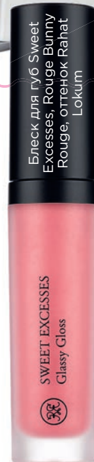
Блеск для губ Sweet Excesses, Rouge Bunny Rouge, оттенок Rahat Lokum

Нейтральная цветовая гамма – ваш главный союзник. Золотисто-бронзовые тени, нежно-розовый блеск или помада, сдержанный маникюр способны превратить вас в истинную леди. Тональные средства помогут добиться идеального тона кожи.