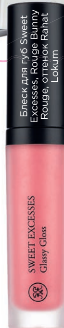
Блеск для губ Sweet Excesses, Rouge Bunny Rouge, оттенок Rahat Lokum

Нейтральная цветовая гамма – ваш главный союзник. Золотисто-бронзовые тени, нежно-розовый блеск или помада, сдержанный маникюр способны превратить вас в истинную леди. Тональные средства помогут добиться идеального тона кожи.