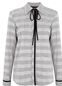
TOPSHOP, 3599 РУБ.