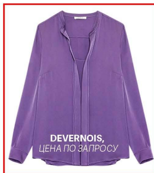
DEVERNOIS, ЦЕНА ПО ЗАПРОСУ

В стиле 70-х — с распахнутым воротом или бантом.