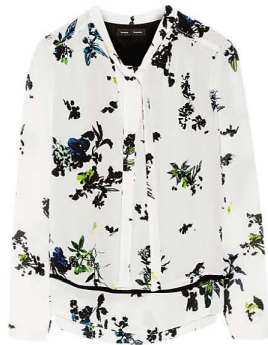
PROENZA SCHOUER, 44 950 РУБ.