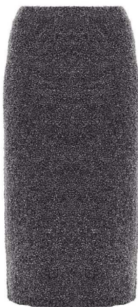
MARKS & SPENCER, 3999 РУБ.