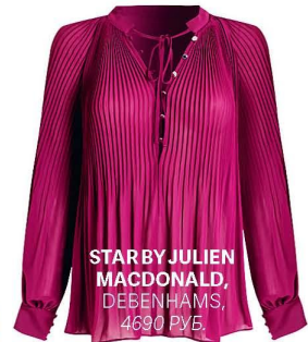
STAR BY JULIEN MACDONALD, DEBENHAMS, 4690 РУБ.