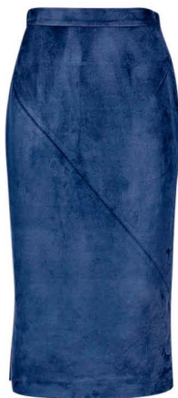
RAOUL, 19 600 РУБ.