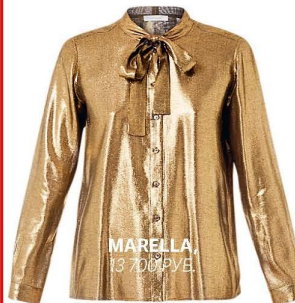
MARELLA, 13 700 РУБ.