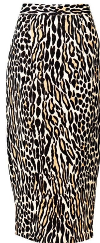
BY MALENE BIRGER, 18 500 РУБ.